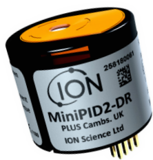
Sensor MiniPID 2