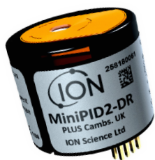
Sensore minipid 2

TVOC 2 è un rilevatore a fotoionizzazione (PID) fisso per la misurazione continua dei composti organici volatili (VOC) totali. Il TVOC 2 consente di misurare con precisione tre intervalli di rilevamento.